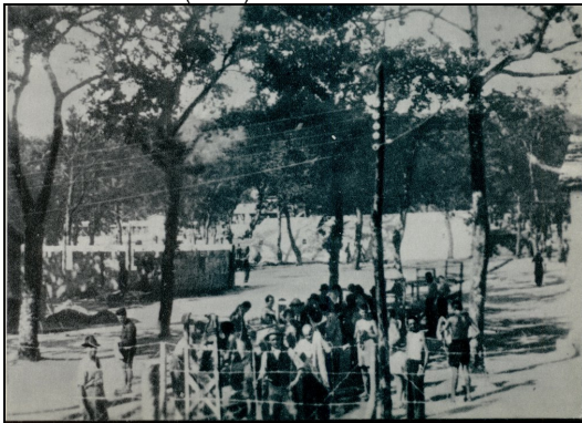
Immagine del campo di Renicci (Anghiari, Arezzo), il più grande lager costruito in Italia per ospitare i civili slavi rastrellati dalle truppe italiane in Slovenia.