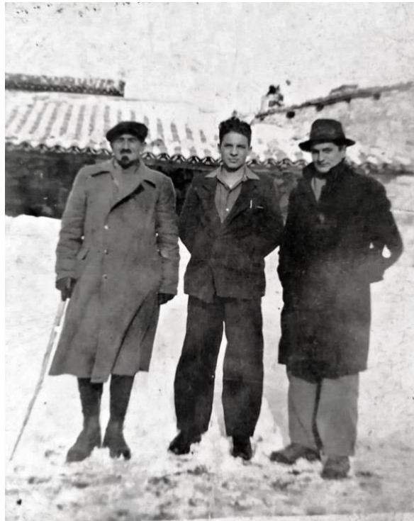
Collecroce di Nocera Umbra, inverno 1944: partigiani jugoslavi

Due partigiani jugoslavi a Laverino (1944)