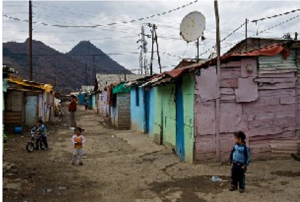
Il campo di Cesmin Lug costruito da ACT (Action by Churches Working Together) e da NCA

IL PREMIO ANTI-CRISTIANO: disonora quell'organizzazione non-governativa che si auto-pubblicizza per promuovere la compassione, l'amministrazione responsabile, ed i diritti basici degli esseri umani... ma fa esattamente l'opposto. NCA viene disonorata da questo premio per aver amministrato i campi zingari a Mitrovica su terreni contaminati per nove anni, dove sono morti 84 Rom ed Askali, molti dei quali bambini piccoli. NCA non ha mai richiesto l'immediata evacuazione, nonostante lo fecero l'OMS e l'ICRC (Comitato Internazionale della Croce Rossa ndr).